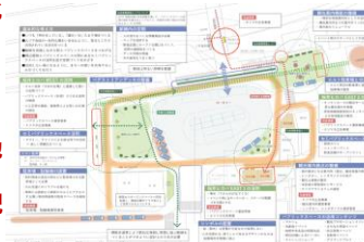
桜井駅前ヒロバ将来構想図

桜井駅前ヒロバ整備・活性化 ⇒情報連携と具体化推進 ・桜井駅前ヒロバ活用ワークショップ開催 3回実施 ・提言・シンポジウム開催 ・公民連携で桜井駅前周辺地区まちづくり連絡会議 ・大型LEDビジョン設置・配信や木製ベンチ12基設置 ・社会実験として駅前マルシェを実施